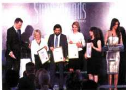
NAJBOLJI „Bambi“, FAS, „Filip Morris“ i „Golden emerald“ dobili specijalna priznanja